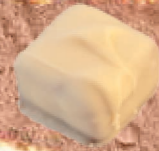
Dentelle de crêpe