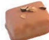
Grué de cacao