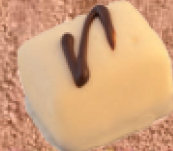
Manon vanille et noisettes