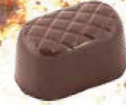
Pignons de pin