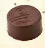
Noix de pécan et café