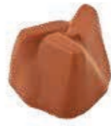
Caramel au beurre salé